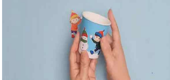
▶ 종이컵에 오린 도안들 붙이기