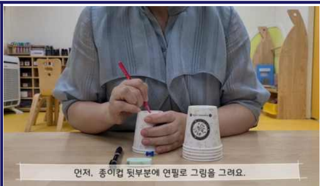
먼저, 종이컵 뒷부분에 연필로 그림을 그려요.