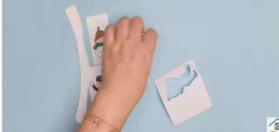
▶ 색칠한 도안 오리기

: 도안, 종이컵, 휴지심, 색칠 도구, A4용지, 풀, 투명테이프, 폼폼이(3cm), 끈, 글루건