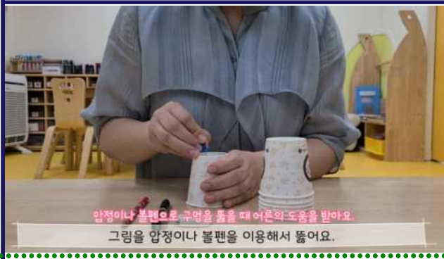
압정이나 볼펜으로 구멍을 뚫을 때 어른의 도움을 받아요. 그림을 압정이나 볼펜을 이용해서 뚫어요.