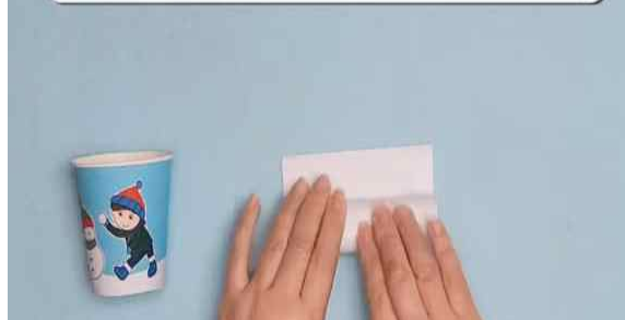
▶ A4용지(흰색 종이) 붙여 정리하기