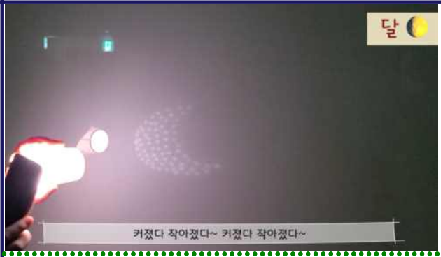
커졌다 작아졌다~ 커졌다 작아졌다~