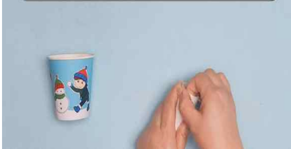
▶ 휴지심 1.5cm정도 잘라 투명테이프 붙이기