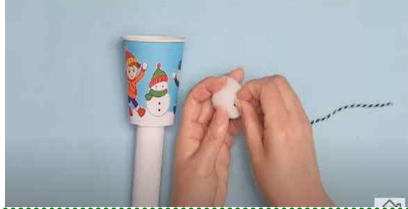
▶ 뽀뽀이 종이컵에 연결하여 완성하기